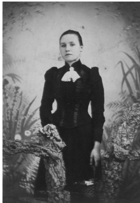
De Haubipreiks Aifaurma, zoals zij zich onlangs per lichtschrijf liet portretteren

De vorige Reiks van Aanzoeking, Ruba Friupareikssuns, leek vlak voor zijn aftreden een geschikte kandidaat te hebben gevonden, vertelden tenminste diverse bronnen. ( zie pagina 2 )