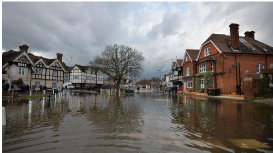
Newport tijdens de overstroming van 2011