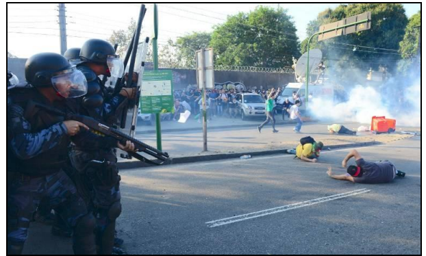
De politie treedt op tegen relschoppers in Divis

DIVIS (15 DECEMBER) – Bij de vierjaarlijkse Voetballandenkampioenschappen van de AGL, de eerste waar Voskiē aan meedeed, is ons land op een dramatische laatste plaats geëindigd, nadat het in de voorrondes in groep 2 alleen de wedstrijd tegen Insulantis wist te winnen. Daarvoor al was bekend dat Voskiē daardoor geen kans zou maken door te stoten naar de halve finales, en in Kvēvuste moest de politie het gebied rond het woonhuis van coach Āfrec Mēters afzetten, nadat teleurgestelde voetbalfans er hun woede op hadden proberen te koelen. De voetballers zijn inmiddels op weg terug naar huis.