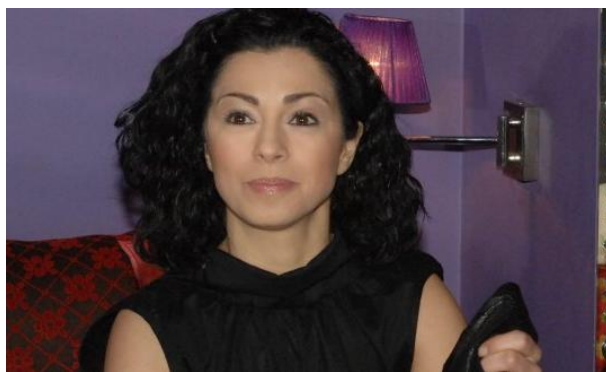
Premier Luċia Apavia bracht haar stem uit in Divis

DIVIS (23 DECEMBER) – De liberale partij V-ĠP van de zittende minister-president Luċia Apavia heeft een verrassende 24% van de stemmen gehaald bij de parlementsverkiezingen van gisteren. Hoewel de officiële uitslag waarschijnlijk na de kerstdagen en mogelijk zelfs pas na 1 januari bekend gemaakt zal worden, is de winst van de V-ĠP onomstotelijk. De andere grote partijen boekten lichte tot zware verliezen; de sociaaldemocratische K-ĠP gaat van 17% van de vorige verkiezingen naar 8,8 nu en hoewel bij de republikeinse PD van oud-premier Arhali de verliezen minder groot zijn, blijft de partij nog ver achter bij de V-ĠP.